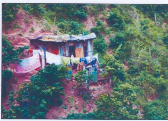
Cada año 6,500 hondureños caen en condición de pobreza por culpa de los corruptos, según un informe del Consejo Nacional Anticorrupción

TEGUCIGALPA. El Consejo Nacional Anticorrupción (CNA) presentó ayer el Informe Nacional de Transparencia que advierte que "Honduras se aproxima a una grave crisis en el futuro inmediato, dados los altos niveles de corrupción".