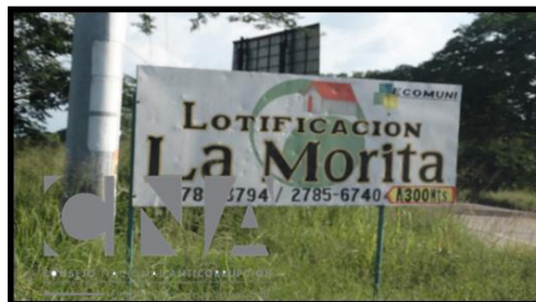
Dos lotes en la aldea Las Moritas, jurisdicción de Juticalpa, Olancho.