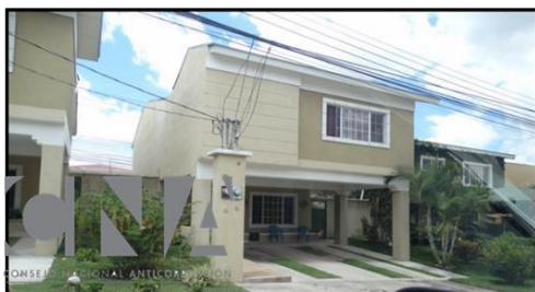
Casa de Habitación en la Res. Portal del Bosque.