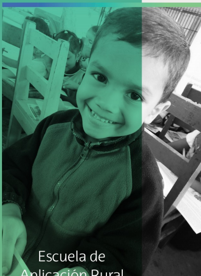
Escuela de Aplicación Rural Sotero Barahona

411 niños y niñas fueron beneficiados entre el periodo de abril a junio de 2018, alcanzando incidir en 268 pequeños de la escuela Club de Leones # 1 y 143 de la escuela de Aplicación Sotero Barahona, ambas ubicadas en el sector de El Hatillo a 10 kilómetros de Tegucigalpa.