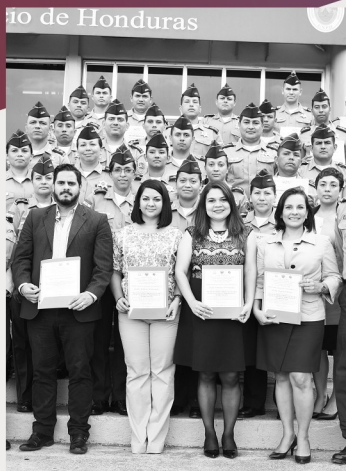
Representantes del CNA junto con participantes de la jornada de formación en valores, moral y ética

Tegucigalpa y 35 servidores públicos que laboran en el Instituto Hondureño de Seguridad Social (IHSS), en el centro regional de La Ceiba.