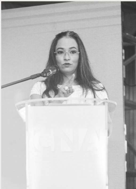
El lanzamiento oficial de la campaña se realizó el pasado 7 de junio durante la entrega del galardón «Dist

De ahí, nace la nueva campaña 2018. De las ganas de devolverle la esperanza a la ciudadanía, de la necesidad de combatir la opresión y de la sed que por fin exista la