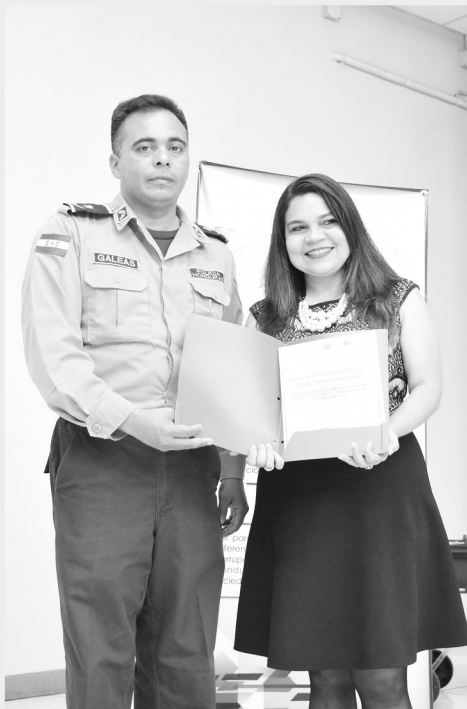
Policía Nacional entrega diploma de reconocimiento a representante del CNA