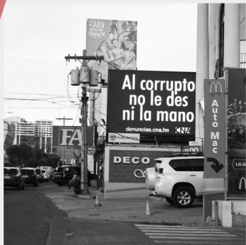
El Consejo en alianza con cinco empresas de publicidad emprendieron una labor histórica para colocar vallas entre Tegucigalpa y San Pedro Sula