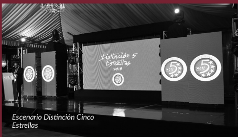
Escenario Distinción Cinco Estrellas