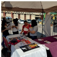
UAS, atendiendo a ciudadanos

Por lo anterior, es posible destacar, que, para el primer trimestre de 2018, el CNA pudo llegar a ciudades importantes como Siguatepeque, Danlí y Comayagua, para entregar el informe de acciones en el combate frontal a la corrupción 2017 y entablar comunicación directa con al menos 741 ciudadanos, quienes también obtuvieron un folleto de denuncia y material de utilidad.