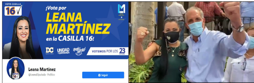
Tabla n.º 3